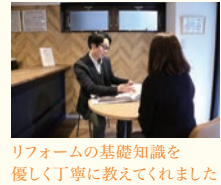
リフォームの基礎知識を優しく丁寧に教えてくださいました