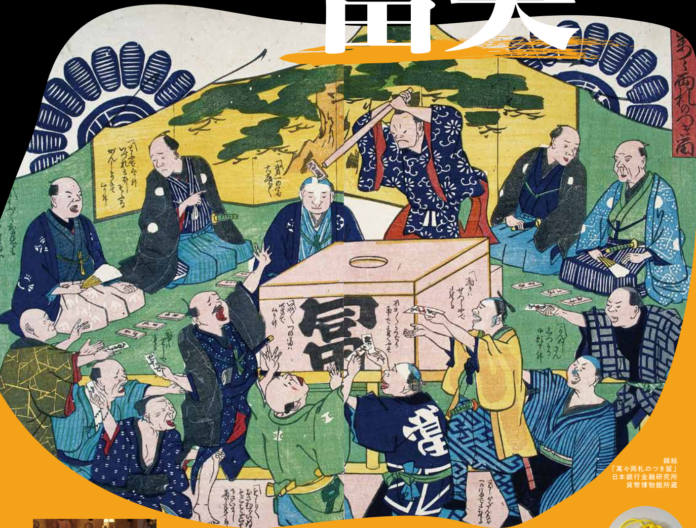
錦絵 「萬々兩札のつき留」 日本銀行金融研究所 貨幣博物館所蔵