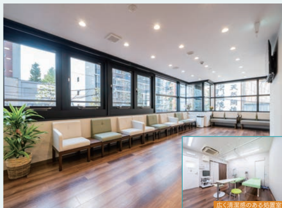
広く清潔感のある処置室

日本大学医学部卒業 お茶の水・井上眼科病院を 経て開業 / 日本眼科学会認 定眼科専門医、東京都眼科 医学会常任理事、日本眼科 学会代議員、日本緑内障学 会、日本小児眼科学会ほか5 学会に所属