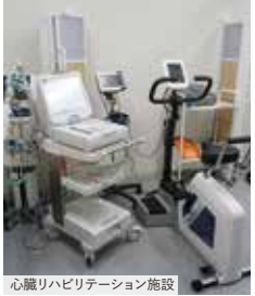
心臓リハビリテーション施設

目白駅前すぐ。「お忙しい方こそ、健康を気にしていただきたい」という想いで、平日19時、土日診療を行うクリニック。呼吸器やアレルギー疾患、不整脈や心不全等の循環器疾患、高血圧や糖尿病などの生活習慣病、むくみ外来まで幅広く対応。山手メディカルセンター、東京医科歯科大学病院、聖母病院とも連携し、地域の「かかりつけ医」を目指しています。