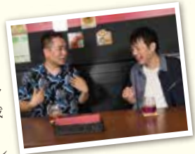
ロケ地: Pia Cuore (ピアクオーレ) P9