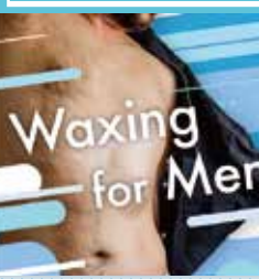
Waxing for Men

ジモア限定 初回割引 鼻毛脱毛 2,200円 ⇒ 1,100円 VIO脱毛 11,000円 ⇒ 8,800円 ※デザイン脱毛可能 ※特価併用可 ※税込み