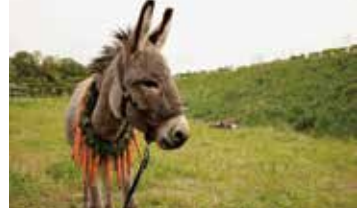
(C) 2022 Skopia Film, Alien Films, Warmia-Masuria Film Fund/Centre for Education and Cultural Initiatives in Olsztyn, Podkarpackie Regional Film Fund, Strefa Kultury Wroclaw, Polwell, Moderator Investycje, Veilo ALL RIGHTS RESERVED

『EO』 2022年ノポーランド・イタリアノ88分ノDCP 第75回カンヌ国際映画祭審査員賞・作曲賞受賞/ 全米映画批評家協会賞外国語映画賞・撮影賞受賞