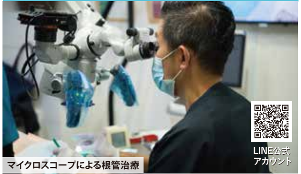
マイクロスコープによる根管治療